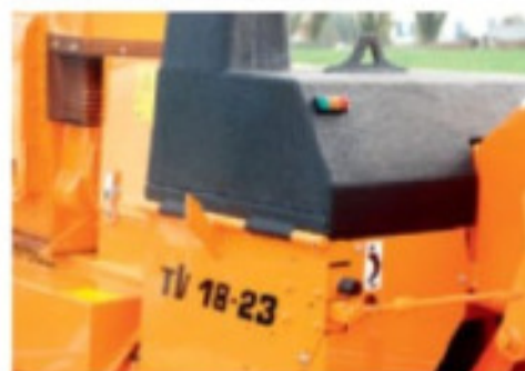
En standard: coating antibruit sur le capot supérieur, sur l'accouplement et sur la trémie.