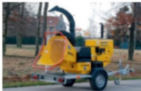
TV18-23D; entraînée par moteur diesel sur remorque transport rapide avec simple essieu.

Tv 18-23 ECOlogic DECHIQUETEUSE DE BRANCHES