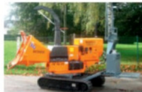
TV18-23DTC; version moteur autonome sur chenilles.

Machine compacte, entraînée par moteur diesel, prévue pour le broyage de taille de haies, ou de branches d'un diamètre maximum de 180 mm. Disponible en deux versions.