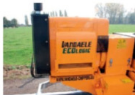
Moteur HATZ diesel 52 CV avec "Silent Pack" en standard.

A: 1700mm B: 1600mm C: 2000mm D: 1600mm E: 2600mm F: 2470mm G: 1900mm H: 1350kg I: 2000mm J: 2000mm K: 2000mm L: 2000mm M: 2000mm N: 2000mm O: 2000mm P: 2000mm Q: 2000mm R: 2000mm S: 2000mm T: 2000mm U: 2000mm V: 2000mm W: 2000mm X: 2000mm Y: 2000mm Z: 2000mm