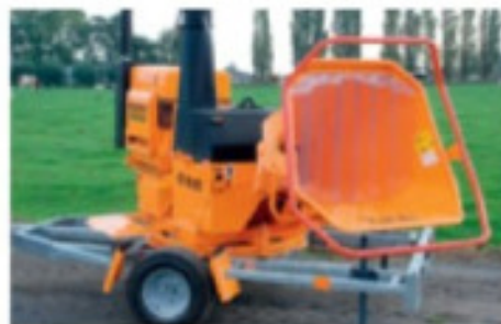
En option: machine sur tourelle 360°.