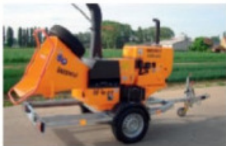
Version standard avec remorque pour transport rapide sur simple essieu et timon fixe.