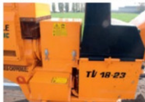
Construction « en ligne » avec entraînement direct – sans courroie ni chaîne.