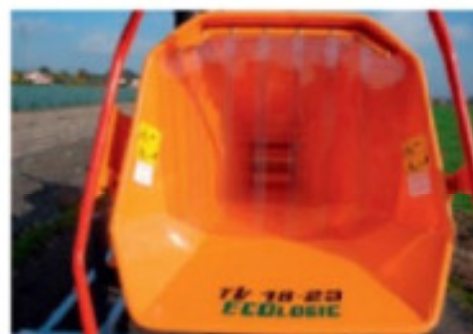
Rideau en plastique dans la trémie empêchant toute projection (sécurité et insonorisation).